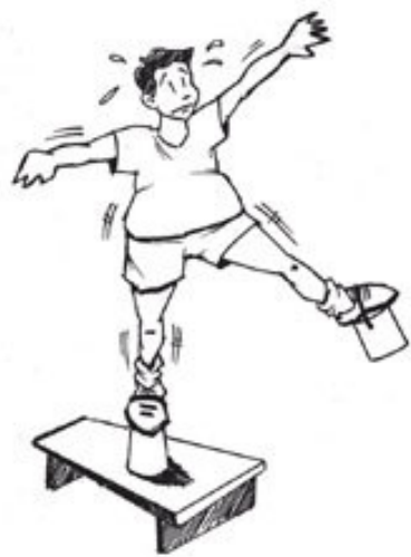
Figura 04. Plataformas amarradas nos pés.

Nossa opção se justifica devido a transferência “positiva” entre os movimentos realizados nas plataformas (03 e 04) e os realizados no modelo normal (02), algo que não acontece com o modelo 01. Além disso, o tipo de equilíbrio praticado nestas plataformas é o mesmo do modelo 02, o que não acontece com o modelo 01, devido ao tipo de apoio (realizado nas mãos). Isso não significa que devemos negar a existência do modelo 01 e deixar de utilizá-lo, simplesmente queremos explicar que não deve ser utilizado como o recurso pedagógico (progressão) mais importante.